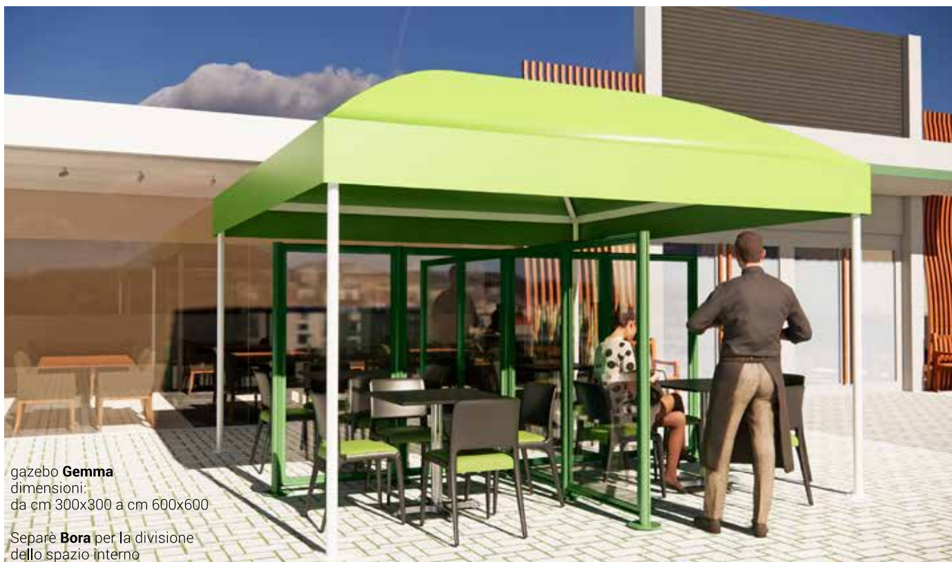
gazebo Gemma dimensioni: da cm 300x300 a cm 600x600

Separè Bora per la divisione dello spazio interno