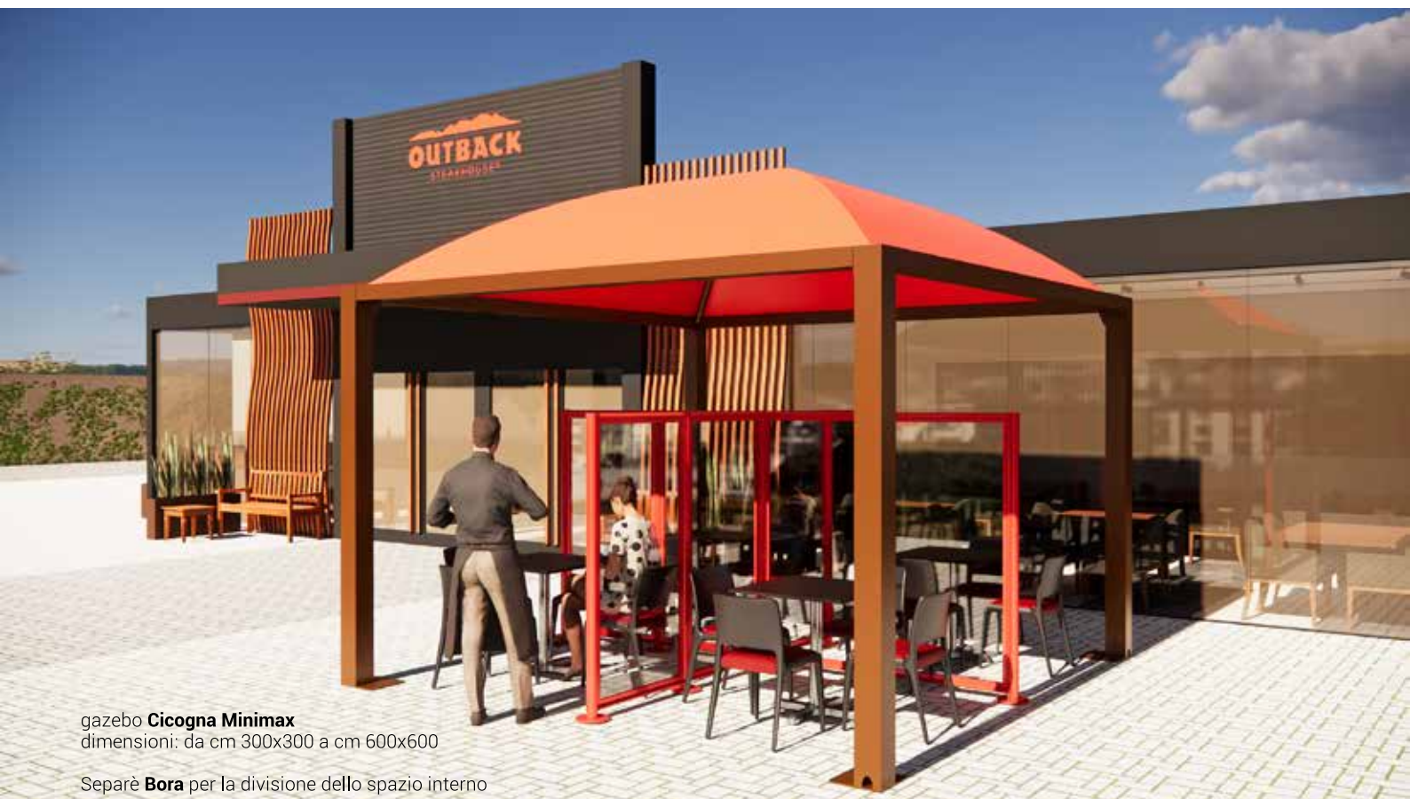
gazebo Cicogna Minimax dimensioni: da cm 300x300 a cm 600x600

Separè Bora per la divisione dello spazio interno