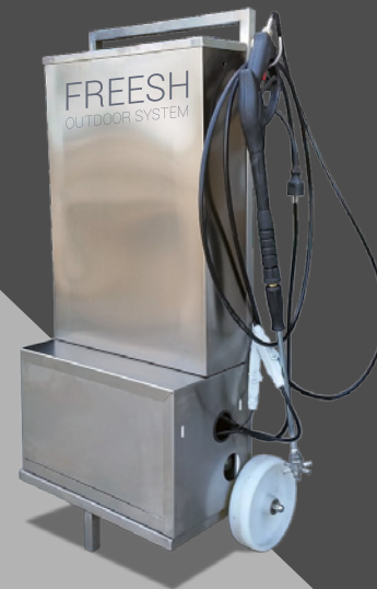
Carrello con pompa e serbatoio Trolley with tank and pump Chariot avec la pompe et la réservoir